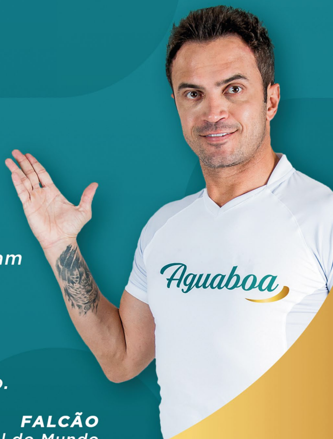
FALCÃO Melhor jogador de Futsal do Mundo